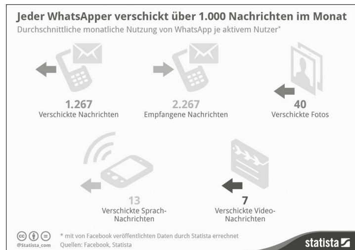
Abb. 18 Der typische WhatsApp-User, Daten von 2013 (STATISTA 2014)

2009 gegründet, wurde der Dienst schnell erfolgreich und schließlich 2014 von Facebook aufgekauft. Laut STATISTA (2014) hat der damalige durchschnittliche User monatlich 1.267 Textnachrichten verschickt und (wegen der Gruppenfunktion) 2.267 empfangen.