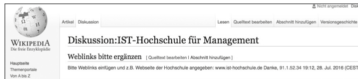
Abb. 17 „Diskussionsseite“ zu einem „Artikel“ in Wikipedia – Leseansicht ( https://wikipedia.de )

Empfehlenswert ist daher, nicht selbst in Artikeln zu editieren, sondern auf der mit dem Artikel verbundenen „Diskussionsseite“ (Reiter links oberhalb des Artikels) einen Eintrag mit Bitte um Ergänzung oder Korrektur zu hinterlassen.