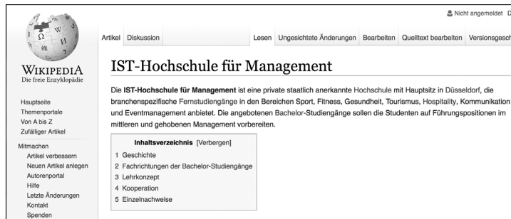
Abb. 16 „Artikel“ in Wikipedia-Leseansicht ( https://wikipedia.de )

Wie kann man Fehler oder Defizite bei Wikipedia korrigieren? Wikipedia behauptet von sich selbst, demokratisch zu sein und jedermann zum Mitmachen einzuladen. Einzelne Änderungen im Text können theoretisch auch schnell vorgenommen werden – doch sie werden nicht sichtbar. In der deutschsprachigen Wikipedia müssen sie nämlich zunächst von „erfahrenen“ Benutzern überprüft und freigegeben werden. Dies kann schnell gehen, kann aber auch ewig dauern – oder verworfen werden.